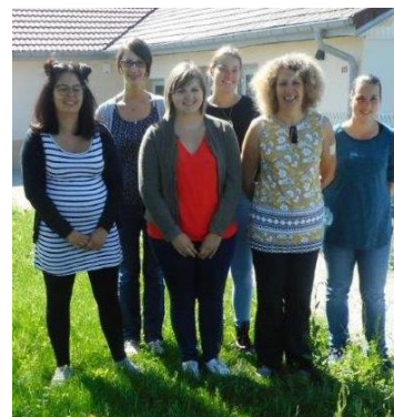
Le personnel du nouveau centre Multi-Accueil...

L'inauguration du centre aura lieu Samedi 16 Novembre 2019 à 11h00.